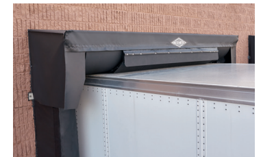
Cabezal resistente a los impactos.