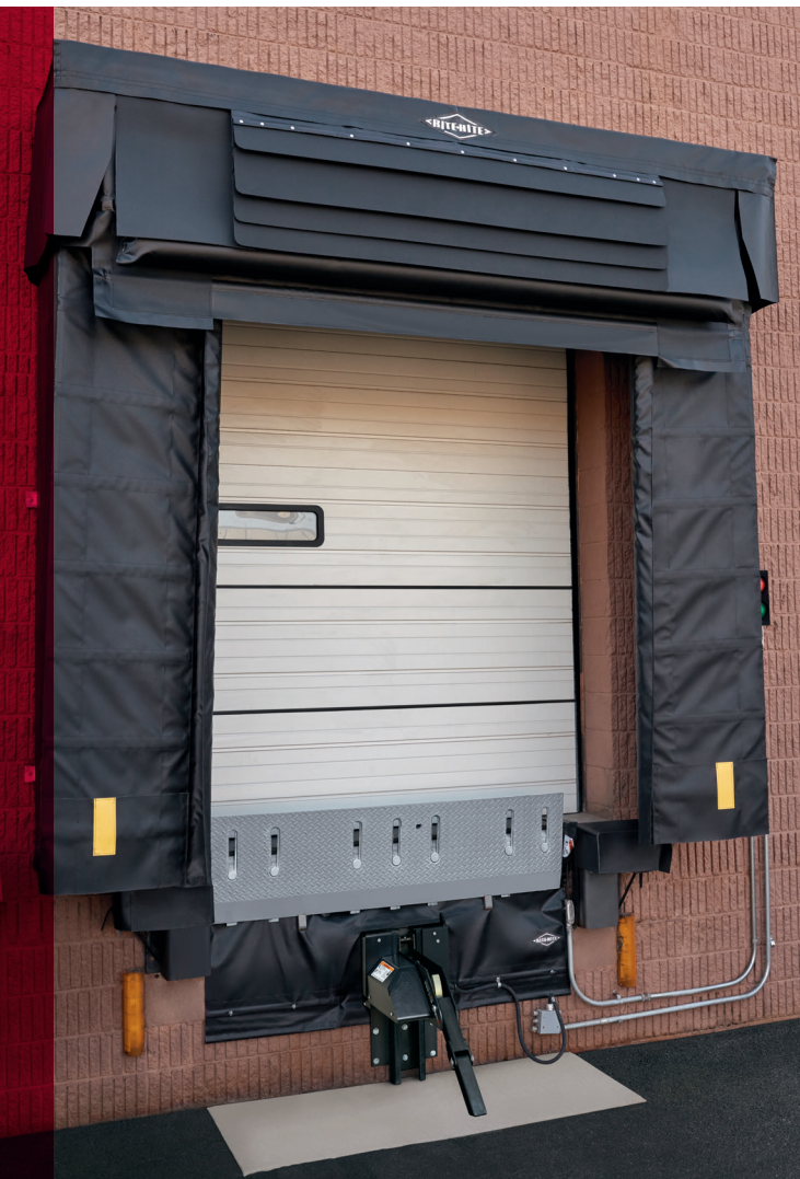
Se muestra el abrigo de andén Eclipse de Rite-Hite® con los sellos debajo del nivelador PitMaster.